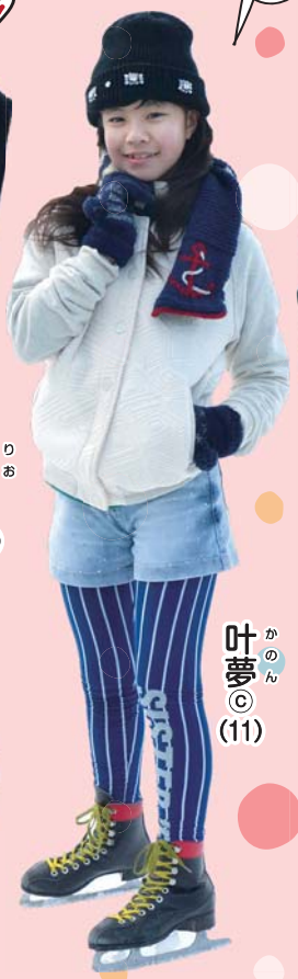
叶夢 © (11)