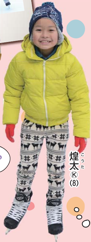
煌太 © (8)