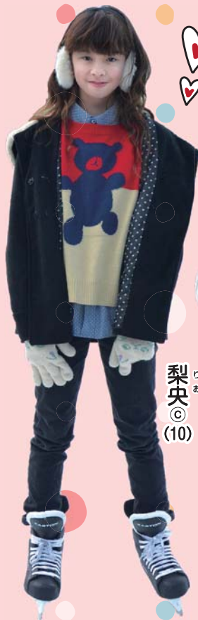
梨央 © (10)