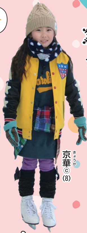
京華 © (8)