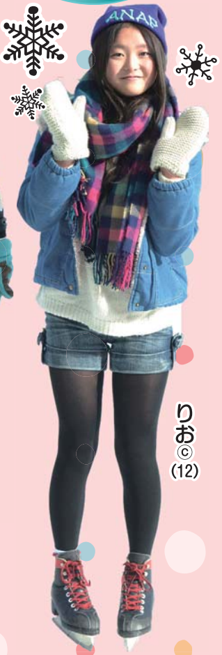
りお © (12)